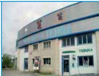
Fachada do Centro Deportivo "Terra"

O Centro Deportivo Terra tamén dispón dun área recreativa ao aire libre, situada en Muxa, e que permanece aberta durante a época estival. Conta con tres canchas de tenis, dúas piscinas, baños e duchas, local social e merendeiro, así como amplias zonas verdes.