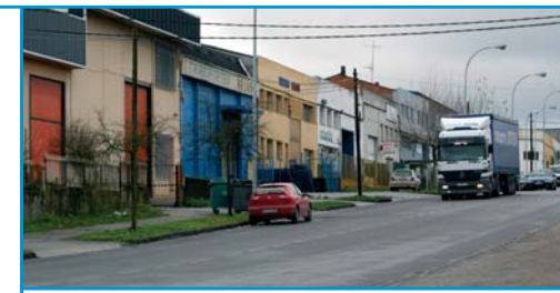
Vista xeral dunha rúa do polígono industrial